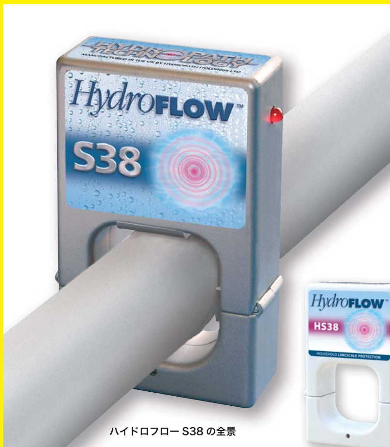
ハイドロフロー S38 の全景